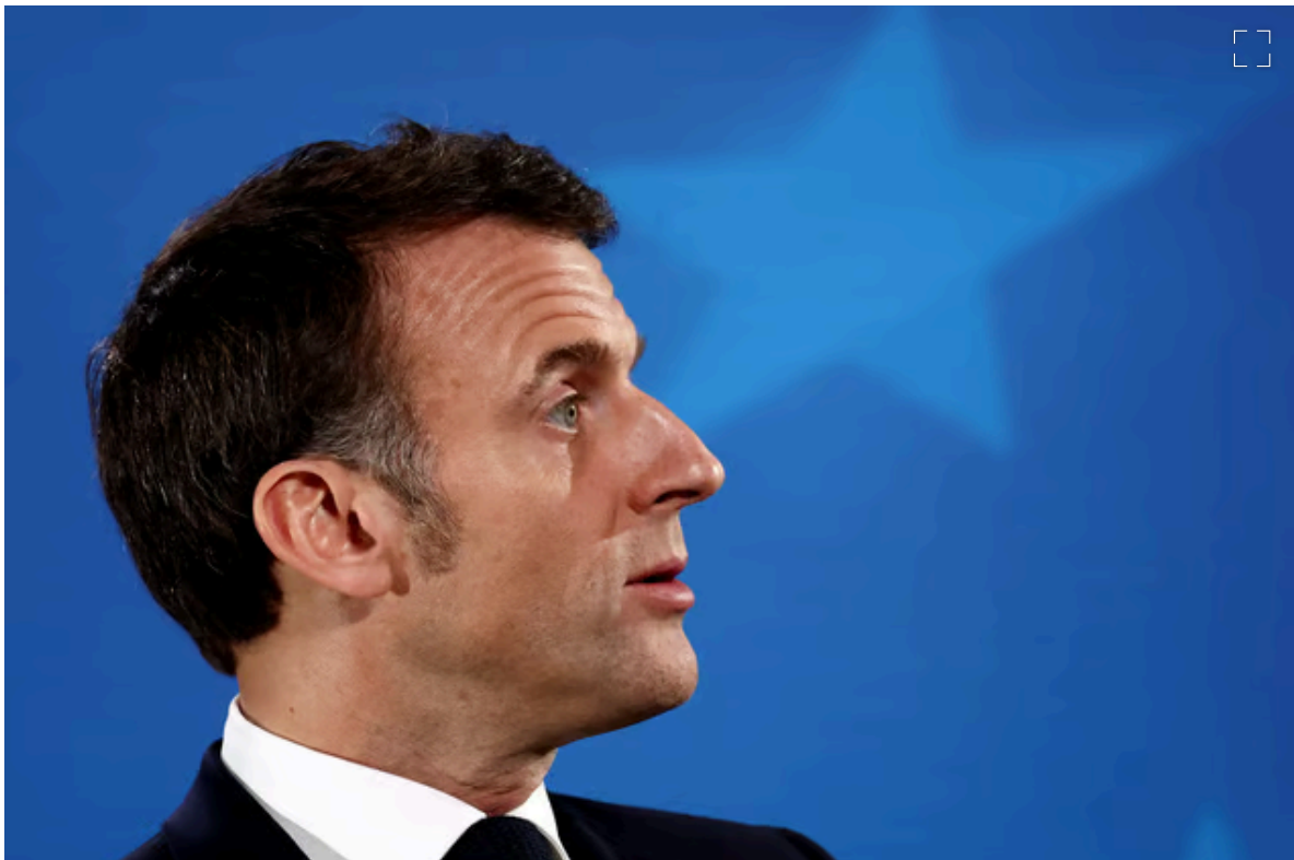
Emmanuel Macron : Le président français s'intéresse à des chiffres de croissance décents, mais aussi de plus en plus à la dette publique endémique.

Quoi qu'il en soit, le gouvernement parisien souligne régulièrement que la deuxième économie de l'UE a mieux traversé les dernières années de crise – la France a connu une croissance deux fois plus rapide que l'Allemagne depuis 2017 et n'a pas à craindre une récession.